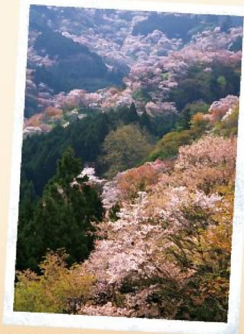
奈良県 / 吉野山